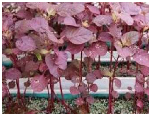
Gambar 2. Tumbuhan Bayam Merah

Diameter bijinya berkisar antara 0,9 hingga 1,7 mm dengan massa sekitar 0,6-1,0 gram. Bayam merah memerlukan sekitar 6-8 jam paparan sinar matahari setiap harinya untuk pertumbuhan yang optimal. Gambaran visual dari tanaman bayam merah dapat dilihat pada Gambar 2 .