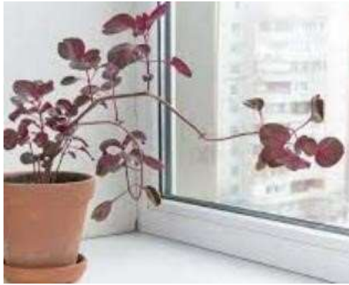
Gambar 3. Penanaman Bayam Merah di Pot

Bayam merah memiliki pertumbuhan yang cepat, dengan periode pertumbuhan sekitar 4-6 minggu (Wolozik dan Agnieszka, 2019). Dalam satu tahun, pemanenan bayam merah dapat berlangsung sekitar 12 kali dalam periode tersebut. Kemampuan bayam merah untuk memberikan panen berulang dan beruntun dalam waktu tertentu sangat menguntungkan. Proses pemanenan juga relatif sederhana, hanya memerlukan gunting, pisau, atau tangan untuk memotong daun-daun bayam merah yang dimulai dari bagian luar tanaman.