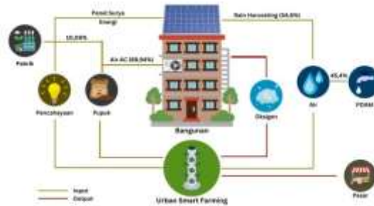
Gambar 7. Siklus Hidup Smart urban farming