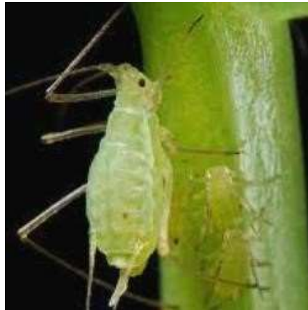
Gambar 4. Hama Tanaman Bayam Merah

merah yang optimal. Sistem rotasi teratur dapat diterapkan untuk mendukung hal tersebut agar mendapatkan sinar matahari yang merata. Tantangan lainnya yang sering ditemui dalam pertanian adalah hama. Contoh hama dapat dilihat pada Gambar 4 .