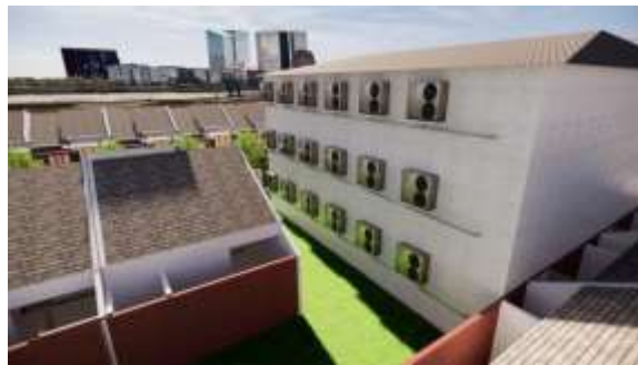
Gambar 6. Render Perpipaans AC Bangunan Smart urban farming