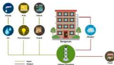
Gambar 6. Siklus Hidup Urban Farming

Terdapat perbedaan pada siklus hidup urban farming dengan smart urban farming . Urban farming memiliki siklus yang cenderung linear dengan siklus sirkular yang ada ialah oksigen yang dihasilkan untuk bangunan yang ada. Pola siklus hidup smart urban farming cenderung sirkular, pencahayaan yang digunakan diambil dari energi surya, air yang digunakan dari rainwater harvesting, dan pupuk menggunakan alternatif air AC yang ada pada kos-kosan. Pola sirkular ini menunjukkan dampak positif yang dimiliki oleh smart urban farming terhadap lingkungan sekitar. Walaupun demikian, rain water harvesting hanya bisa memenuhi 54,6% dari kebutuhan air sedangkan limbah AC bisa menggantikan 89,94% dari limbah pupuk yang sekarang ini sering digunakan. Pada kasus rain water harvesting , hal yang bisa dilakukan untuk meningkatkan jumlah tangkapan air ialah memperluas rain water harvesting . Pada kasus limbah AC, maka alternatif pupuk lainnya seperti hasil kotoran binatang atau semacamnya dapat dipertimbangkan untuk menjamin pola sirkular yang lebih baik pada smart urban farming yang direncanakan. Pola life cycle urban farming dapat dilihat pada Gambar 6 dan pola life cycle smart urban farming dapat dilihat pada Gambar 7 .